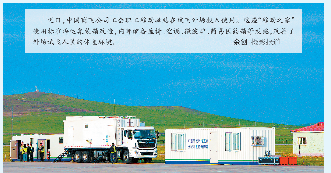
近日，中国商飞公司工会职工移动驿站在试飞外场投入使用。这座“移动之家”使用标准海运集装箱改造，内部配备座椅、空调、微波炉、简易医药箱等设施，改善了外场试飞人员的休息环境。